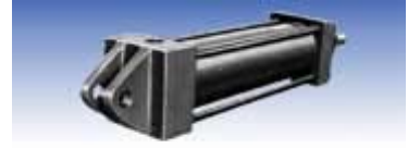
CB型 (二山クレビス形)