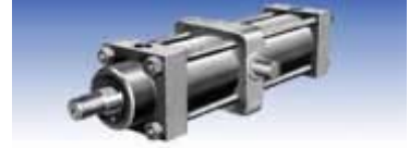
TD型 (軸トラニオン形)