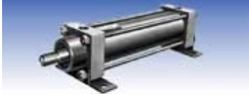
LA型 (軸直角フート形)