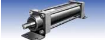
LB型 (軸方向フート形)