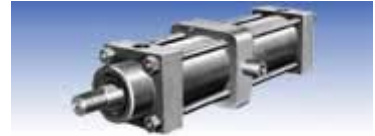
TF型 (めねじトラニオン形)