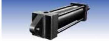
CA型 (一山クレビス形)