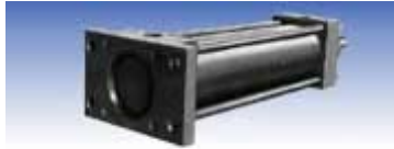
FB型 (ヘッド側フランジ形)