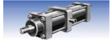
TE型 (穴トラニオン形)